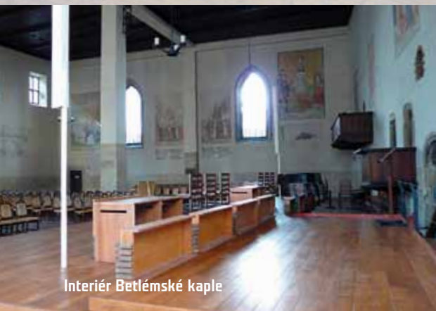
Interiér Betlémské kaple

českou princeznou a jejím přičiněním se rozšířil vliv anglického reformátora v její rodné zemi. Hus si se zájmem přečetl Viklefovy spisy. Uvěřil, že jejich pisatel je upřímný křesťan, a reformy, které prosazoval, se mu líbily. Aniž