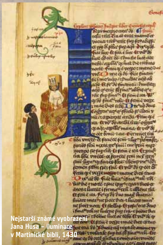
Nejstarší známé vyobrazení Jana Husa – iluminace v Martinické bibli, 1430

a se mnou jest v divných pokušeních, poznáte, až se u Boha v radosti z jeho milosti setkáme.“ (List Husův veškerému národu českému z 10. června 1415)