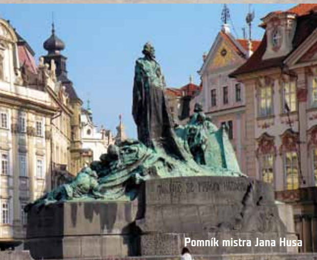
Pomník mistra Jana Husa