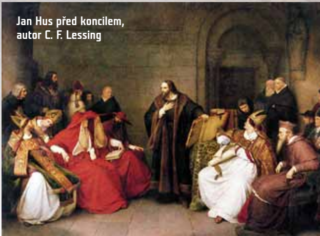
Jan Hus před koncilem, autor C. F. Lessing