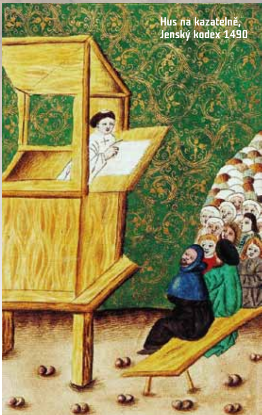
Hus na kazatelně, Jenský kodex 1490

dostavil před papeže. Uposlechnout pozvání však znamenalo vydat se na jistou smrt. Český král a královna, univerzita, šlechta a správní úředníci poslali papeži společnou žádost, aby Hus směl zůstat v Praze a zodpovídat se prostřednictvím zástupce. Papež žádosti nevyhověl, nařídil, aby Hus byl souzen a odsouzen, a pak vyhlásil nad celou Prahou klatbu.