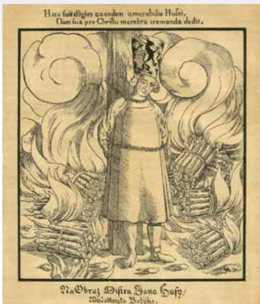
Jan Hus na hranici, dřevoryt 1563

I jeho nepřátelé byli překvapeni jeho odvážným vystupováním. Jeden z horlivých zastánců papežství popsal mučednictví Husa a Jeronýma, který zemřel nedlouho potom, slovy: „Oba byli pevné mysli, když se přiblížila jejich poslední hodina. Chystali se na hranici, jako by šli na svatební hostinu. Nevydali ze sebe jediný vý-