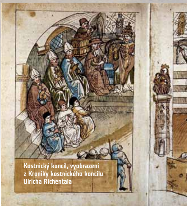
Kostnický koncil, vyobrazení z Kroniky kostnického koncilu Ulricha Richentalta

Jan Hus. Vzдорopapežové se obávali o vlastní bezpečnost, proto se osobně nedostavili, ale dali se zastoupit svými vyslanci. Ačkoli papež