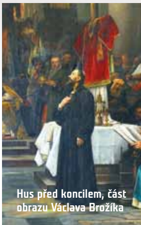
Hus před koncilem, část obrazu Václava Brožíka

Oslaben pobyt ve vězení – v němž díky vlhkému a zatuchlému prostředí onemocněl zimnicí, která ho málem připravila o život – předstoupil Hus konečně před koncil. V řetězech stál před císařem, který se svou ctí zavázal, že ho ochrání. Během dlouhého procesu zastával